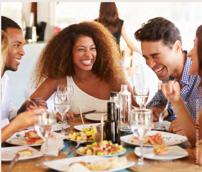
Un restaurant ouvert même en dehors des heures de marché

La halle Charras sera un nouveau lieu de vie pour les Courbevoisins. Vous retrouverez vos commerçants préférés installés dans 44 étals flambant neufs. Cette halle « nouvelle génération » vous réservera d'autres surprises. Une connexion wifi ouverte à tous, un restaurant et un service de conciergerie vous seront proposés. De nouveaux espaces verts viendront orner ce