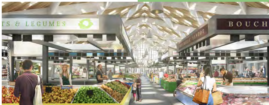
Fin 2019, le chantier laissera la place à votre nouvelle halle de marché.

niveaux. Après cette phase de terrassement, la construction du parking et de la nouvelle halle pourra commencer. Vous ne pourrez pas manquer cette nouvelle étape puisqu'elle s'accompagnera de l'installation d'une grue de 80 mètres en plein cœur du site, vers le mois de novembre.