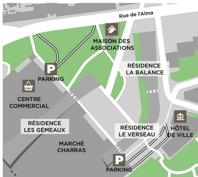
Le quartier aujourd'hui

Les espaces verts sont au cœur du projet de réaménagement du centre-ville de Courbevoie. Autour de la nouvelle halle Charras, il y aura 75 nouveaux arbres dont 10 sujets conservés après les travaux. De nombreux arbustes et plantes vivaces amèneront en outre une grande diversité de végétation en plein centre-ville.