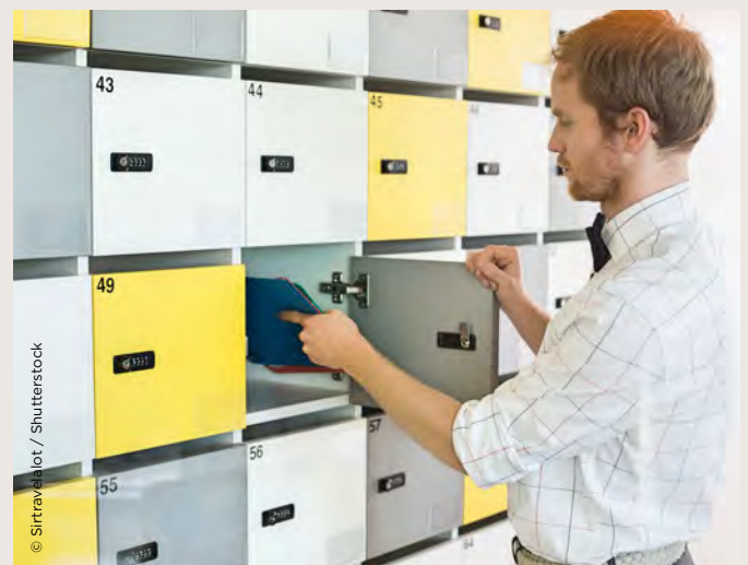
Un tout nouveau service de conciergerie.

nouveau bâtiment : ils vous inviteront à la balade et à la tranquillité les jours d'été. Grâce à un parking sur 3 niveaux et plus de 500 places, garer sa voiture, dans le centre-ville de Courbevoie, deviendra facile. Tout au long de l'année, vos commerçants vous proposeront des animations à thème : vous retrouverez, ainsi, l'ambiance chaleureuse des marchés d'antan dans un cadre moderne et dynamique !